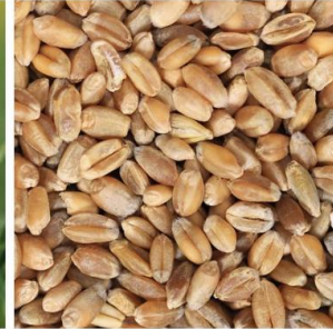
Viljan toimitus Fazer Myllylle