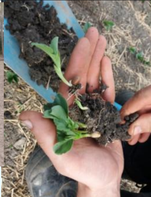
Pellon kasvukunnon puolella